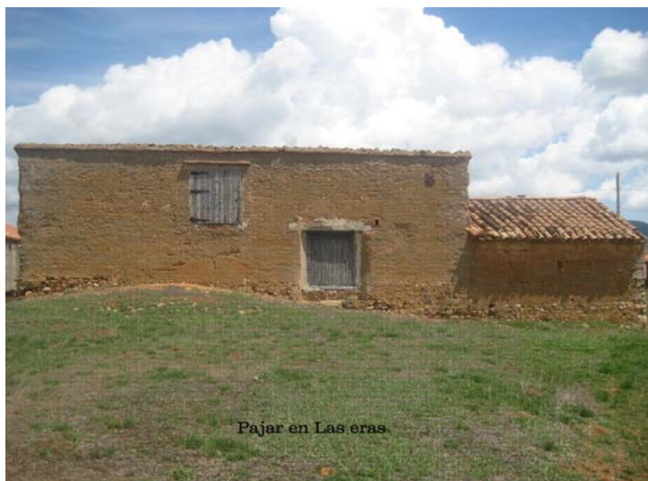
Pajar en Las eras

Su extensión es alrededor de 170 hectáreas de tierra de secano donde predomina el cultivo del cereal y cuyo rendimiento agrícola es inferior, en términos generales, en comparación a otras zonas de secano de Villahermosa.